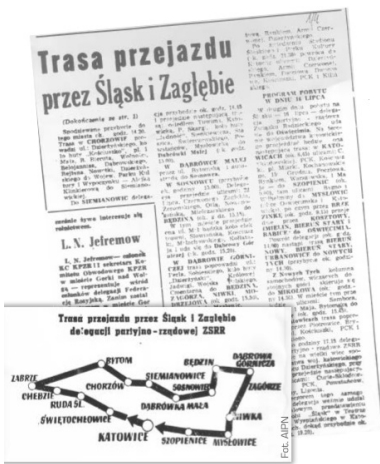
Trasa przejazdu I sekretarza KC KPZR i premiera Związku Radzieckiego była podana do publicznej wiadomości