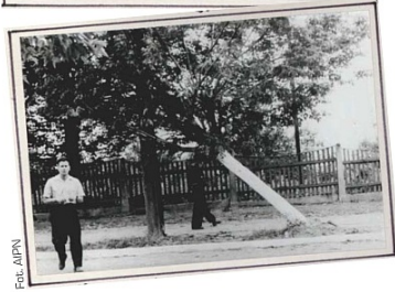
► Miejsce wybuchu bomby kilka dni po eksplozji – na zdjęciach widoczne uszkodzone drzewo