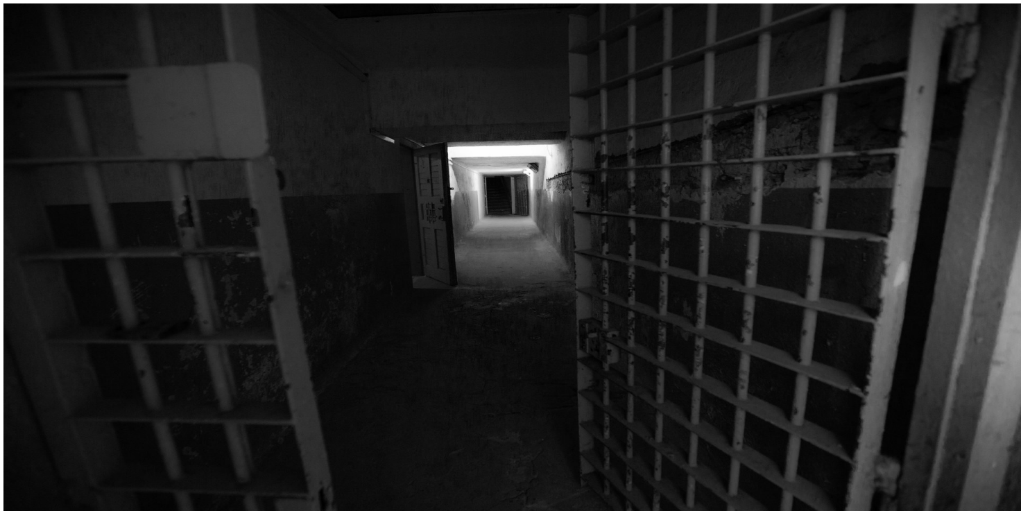
Byłe więzienie przy ul. Rakowieckiej w Warszawie.

https://przystanekhistoria.pl/pa2/tematy/aparat-bezpieczenstwa/106201,Przesladowanie-Emilii-z-Maleczynskich-Trebickiej-w-wiezieniu-mokotowskim-Relacja.html