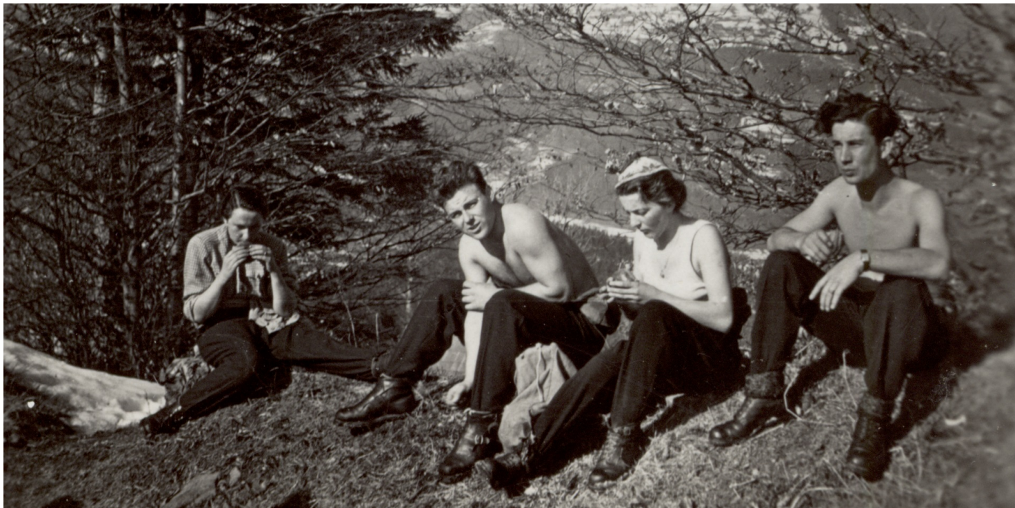
Kazimierz Chmielowski na Żywiecczyźnie, 1948 r.

https://przystanekhistoria.pl/pa2/tematy/aparat-bezpieczenstwa/100630,Rekin-i-Kosa-Historia-milosci-zapisana-w-grypsach.html