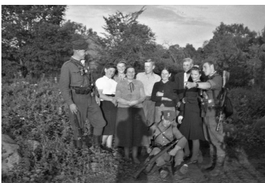
„Rekin” w towarzystwie jednej z patriotycznych podlaskich rodzin - Białostoczczyzna, 1945 r.

W lipcu 1944 r. 3. Brygada AK, wraz z pozostałymi siłami wileńsko-nowogródzkiego zgrupowania AK, zaatakowała Wilno. Krwawe walki z Niemcami nie zostały uwieńczone sukcesem. Partyzanci nie zdobyli miasta przed nadejściem Sowietów. „Rekin” podczas walk o Wilno został poważnie ranny, była to jego czwarta bojowa rana. Gdy leżał w szpitalu, został aresztowany przez NKWD i wywieziony do obozu w Kałudze.