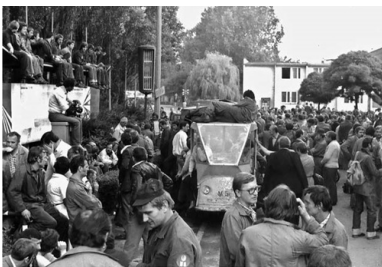
Strajkujący stoczniowcy na placu przed budynkiem dyrekcji...