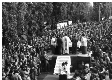
Msza św. w Stoczni Gdańskiej