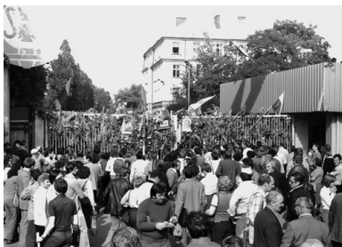
Druga brama Stoczni Gdańskiej im. Lenina w czasie strajku w sierpniu 1980 r.

W piątek, 15 sierpnia do strajku w „Leninie” oprócz komunikacji miejskiej przyłączyły się nowe zakłady, m.in. Stocznia im. Komuny Paryskiej w Gdyni, Gdańska Stocznia Remontowa, Stocznia Północna im. Bohaterów Westerplatte w Gdańsku, Stocznia Remontowa „Nauta” w Gdyni, Zarządy Portu w Gdańsku i Gdyni, Gdańskie Zakłady Rafineryjne, Zakłady Okrętowych Urządzeń Elektrycznych i Automatyki „Elmor” w Gdańsku, gdański PKS.