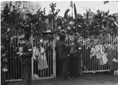
Druga brama Stoczni Gdańskiej im. Lenina w czasie strajku w sierpniu 1980 r.