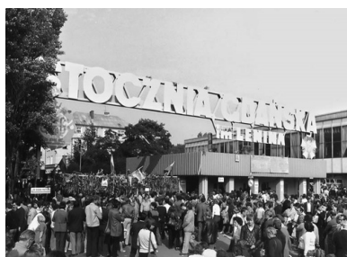
Druga brama Stoczni Gdańskiej im. Lenina w czasie strajku w sierpniu 1980 r.