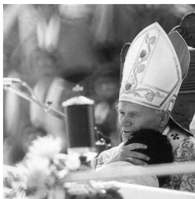
Papież Jan Paweł II podczas mszy św. w São Paulo

Tanecznymi krokami powitali papieża także mieszkańcy faveli, Vidigal. Spotkanie w dzielnicy biedy zgromadziło dwustuosobowy tłum ściśniętych ludzi, którzy w rękach trzymali tablice z napisami „Pijemy wodę z rynsztoków”, „Jesteśmy błogosławieni przez Boga, lecz odrzuceni przez społeczeństwo”. Energia i radość cariocas (określenie mieszkańców Rio), która z nich wypływała, przy zderzeniu z wszechogarniającą nędzą slumsów, spowodowała, iż Jan Paweł II ściągnął z palca pierścień (otrzymał go w 1967 r., z rąk papieża Pawła VI, w dniu otrzymania biretu kardynalskiego) i podarował go najbiedniejszej parafii.