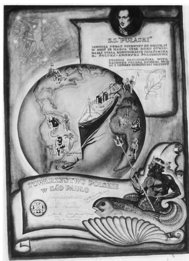
Fotografia dyplomu, który został wręczony kapitanowi statku SS Pułaski przez Towarzystwo Polskie w Sao Paulo, 1936 r.

Według danych opublikowanych w Raporcie o sytuacji Polonii i Polaków za granicą (przygotowanym dla potrzeb Ministerstwa Spraw Zagranicznych RP) do 2009 r. najprężniej działającym stowarzyszeniem w Kurytybie było Towarzystwo im. Marszałka Józefa Piłsudskiego, które funkcjonuje od 1936 r.