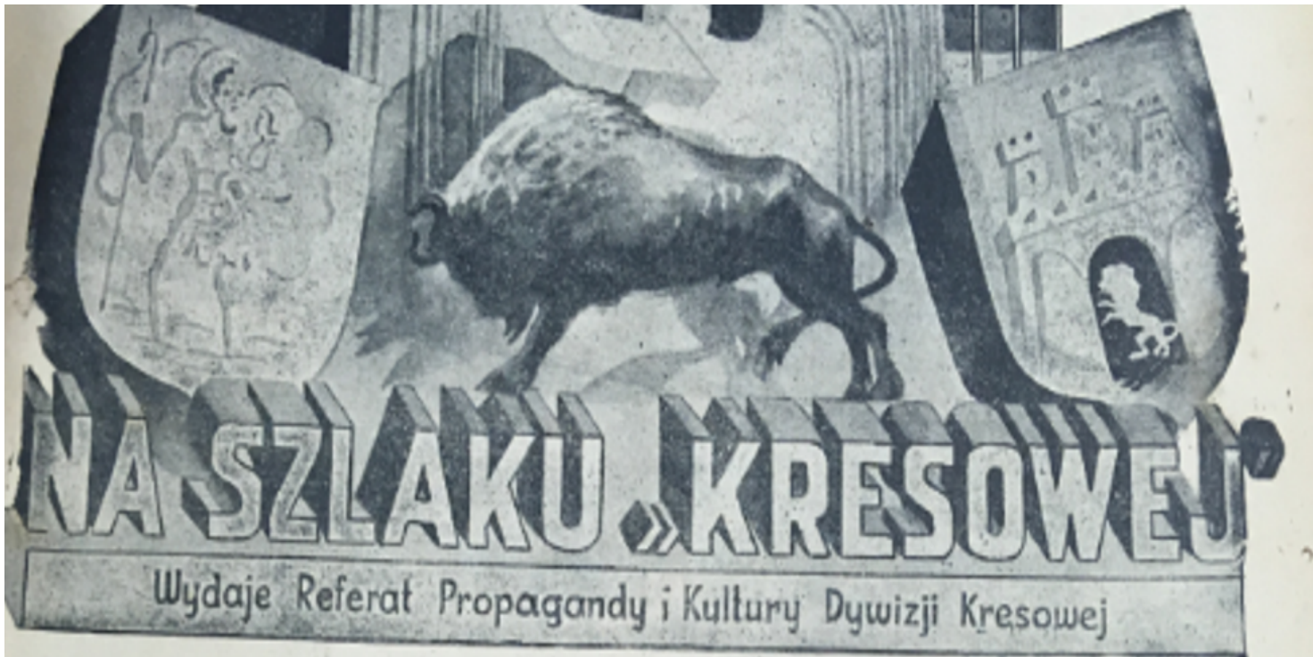
Na szlaku "Kresowej"

https://przystanekhistoria.pl/pa2/tematy/ameryka-lacinska/93112,Mistrz-recenzji-rzecz-o-Jerzym-Woszczyninie.html