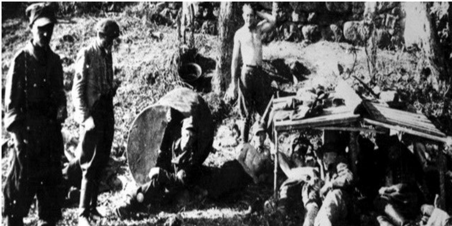
Ze zbiorów Muzeum AK Okręgu Wilno „Wiano”

https://przystanekhistoria.pl/pa2/tematy/akcja-burza/78521,Sowiecki-oboz-w-Miednikach-Krolewskich.html