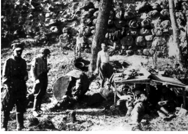
Żołnierze AK trzymany przez sowietów pod gołym niebem w obozie w Miednikach Królewskich.