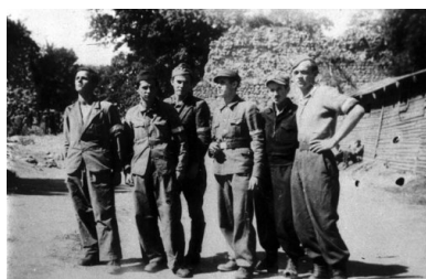
Żołnierze AK w obozie w Miednikach Królewskich.

„Dokuczał nam głód – wspominał jeden z osadzonych żołnierzy – bo tylko od czasu do czasu dostawaliśmy kawałek czarnego suchara i parę łyżeczek jaglanej kaszy rozgotowanej na wodzie bez odrobiny tłuszczu”.