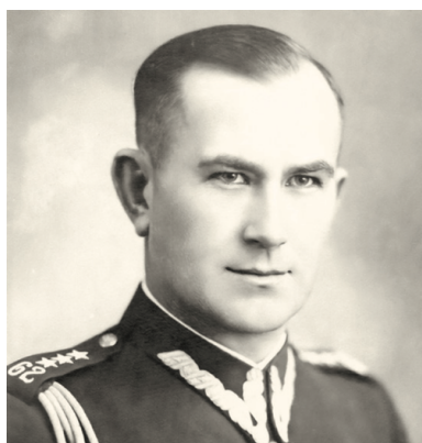
Pułkownik Władysław Liniarski „Mścisław” - komendant Okręgu AK Białystok

W myśl rozkazu „Burza” mieli kierować poszczególni inspektorzy oraz komendanci obwodów na podległych sobie terenach. Działania bojowe należało przeprowadzać siłami oddziałów partyzanckich, oddziałów Kedywu oraz zmobilizowanymi według uznania inspektorów pododdziałami z sieci terenowej w sile drużyny-plutonu. Wszystkie oddziały przewidziane do bojowego wykorzystania musiały być odpowiednio zaopatrzone w broń i amunicję. Ponadto dowódcy wszystkich szczebli zobowiązani zostali na czas akcji „Burza” do pozostania na miejscu oraz utrzymywania łączności organizacyjnej. W kolejnym rozkazie – z 20 marca 1944 r. – ppłk Liniarski wydał wytyczne uzupełniające w sprawie przeprowadzenia akcji „Burza” przez Okręg AK Białystok. We wskazówkach wykonawczych główny nacisk położył na kwestię ochrony ludności cywilnej przed represjami niemieckimi, samoobronę oraz uniemożliwienie Niemcom dokonywania zniszczeń. Jednocześnie rozkaz określał sposoby postępowania w przypadku przewidywanego wrogiego nastawienia oddziałów Armii Czerwonej. Nakazywał niszczenie wszelkich dokumentów dotyczących ewidencji ludności pozostawionych przez władze niemieckie, a osobom zdekonspirowanym działalnością niepodległościową zalecał ukrycie się.