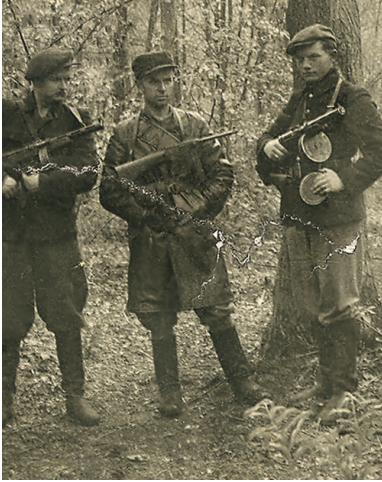
Ppor. Tadeusz Westfal „Ostroga” (w środku) - dowódca Kedywu i oddziałów partyzanckich Okręgu AK Białystok, poległ 8 lipca 1944 r.