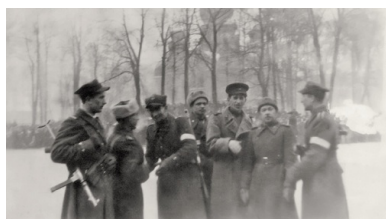
Partyzanci oddziału AK ppor.

Upadek powstania w Warszawie wpłynął na zmianę zamierzeń kierownictwa Okręgu Śląskiego. Latem 1944 r., pomimo ponurych wieści dochodzących ze wschodu, tutejsze oddziały partyzanckie przygotowywały się do wykonania rozkazów przekazanych wcześniej z KG AK. Również i tu „Burza” wyglądać miała tak samo jak wszędzie – wkraczających czerwonoarmistów w charakterze gospodarzy witać miały miejscowe struktury AK oraz odtworzone władze cywilne. Wiele napisano już o infantylizmie podobnych planów, jednak niepoprawny optymizm ich twórców wciąż budzi zdumienie. Zwłaszcza upieranie się przy ich realizacji w obliczu klęski operacji „Ostra Brama” i późniejszego o kilka tygodni wystąpienia we Lwowie. Nie darmo jeden z autorów jakiś czas temu nazwał „Burzę” znacznie bardziej stosownie – operacją „Harakiri”.