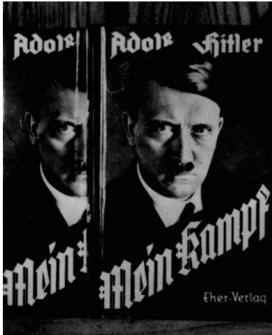
Okładka książki Mein Kampf z podobizną Adolfa Hitlera.

niedopracowaną. Część wspomnieniowa urywa się nagle w tomie pierwszym, a następnie tak samo niespodziewanie Hitler powraca do niej w tomie drugim. Kilka rozdziałów zostało wręcz naszkicowanych, skrótowo odnosząc się do kwestii mniej interesujących Hitlera. Inne zdumiewają obszernością i szczegółowością. Sam spis treści uświadamia, że rozdziały nie są powiązane ze sobą logicznie. Ich dobór jest przypadkowy, wynikający z faktu, że dwa tomy Mein Kampf powstały w innym czasie.