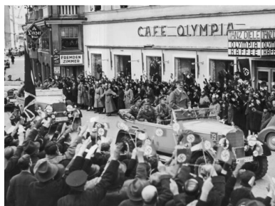
Wizyta Adolfa Hitlera w Linzu po Anschlussie Austrii, 13 marca 1938 r.