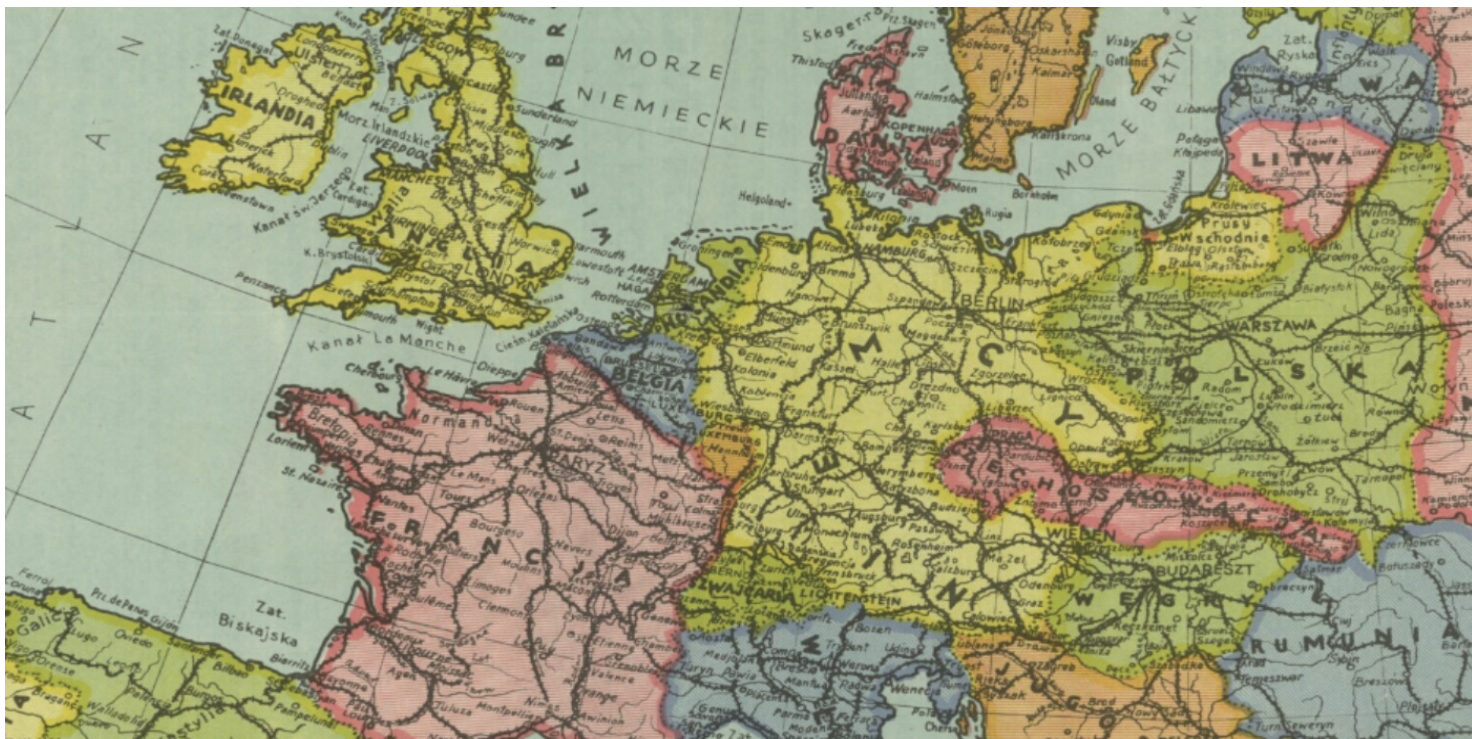
Europa w 1938 r.

https://przystanekhistoria.pl/pa2/tematy/adolf-hitler/78221,Polski-przeklad-Mein-Kampf-Moja-Walka.html