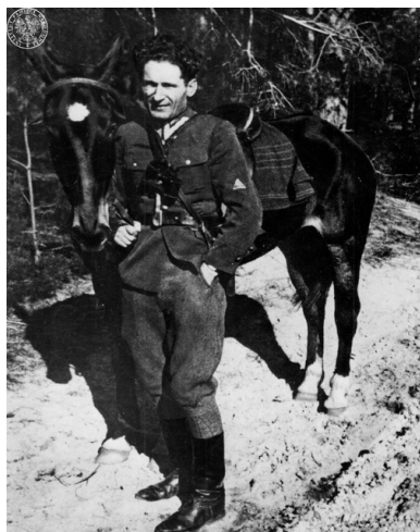
Mieczysław Moczar w czasie działalności partyzanckiej, 1942-1945

W lutym 1943 r. na łamach prasy konspiracyjnej kierownictwo GL nawoływało do akcji scaleniowej podziemia, której celem miało być prowadzenie akcji zbrojnych przeciwko okupantowi. Niepowodzenie planu wywołania powszechnego powstania skłoniło kierownictwo PPR do rozbudowy własnych oddziałów partyzanckich, celem prowadzenia walki zbrojnej. Rozbudowa struktur partyzanckich napotkała na problemy natury logistycznej i materiałowej ze względu na niewielkie wsparcie ze strony ZSRS, który nie miał zaufania do polskich komunistów.