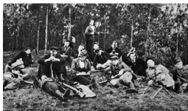
Grupa partyzantów Gwardii Ludowej podczas wypoczynku w lesie, 1942-1944

Nie wiemy, ilu członków liczyły oddziały Gwardii Ludowej w momencie jej powstania. Początkowo jej członkowie na czapkach nosili czerwony trójkąt z napisem „GL”, później został on zastąpiony stylizowanym orłem bez korony. Oficjalnym organem prasowym tej organizacji był „Gwardzista”, a jej hymnem „Marsz Gwardii Ludowej”.