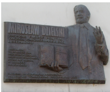
Tablica pamiątkowa na budynku „Herbewo” w Krakowie