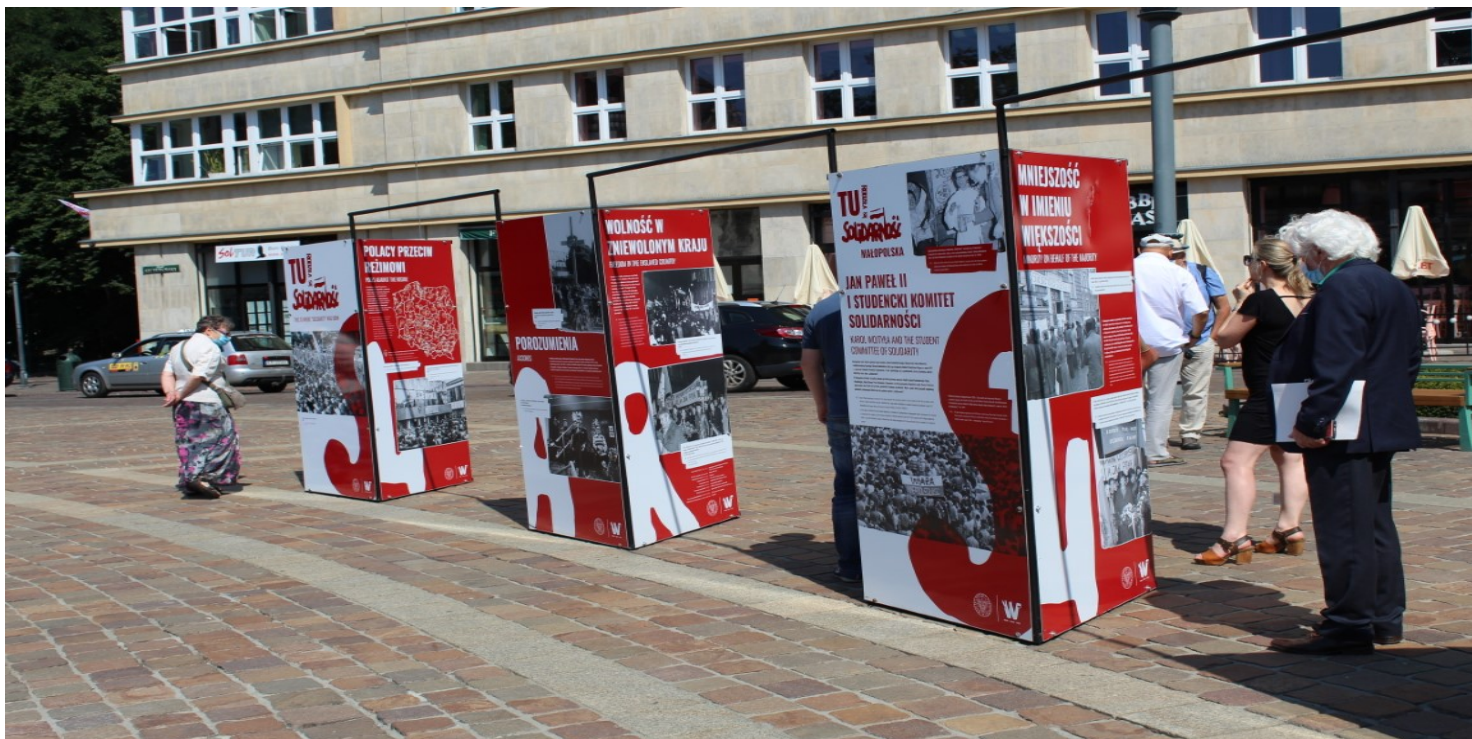
Wystawa „TU rodziła się Solidarność” w Krakowie.

https://przystanekhistoria.pl/pa2/teksty/99775,Mirolaw-Dzielski-1941-1989.html