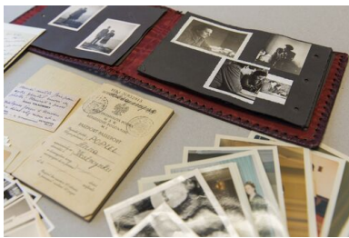
Dokumenty osobiste Anny Poray- Wybranowskiej.