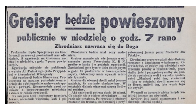
Wycinek prasowy dotyczący egzekucji Arthura Greisera, 1946

Pomimo posiadania siedziby w Poznaniu Arthur Greiser postanowił wybudować willę poza miastem. Wybór padł na Jezioro nad Jeziorem Góreckim – obecnie znajduje się tam siedziba Dyrekcji i Muzeum Wielkopolskiego Parku Narodowego, a miejscowość jest częścią Mosiny. Na wybór lokalizacji wpływ miała odległość od Poznania (około 20 km) oraz zalesienie terenu umożliwiające przeprowadzanie polowań.