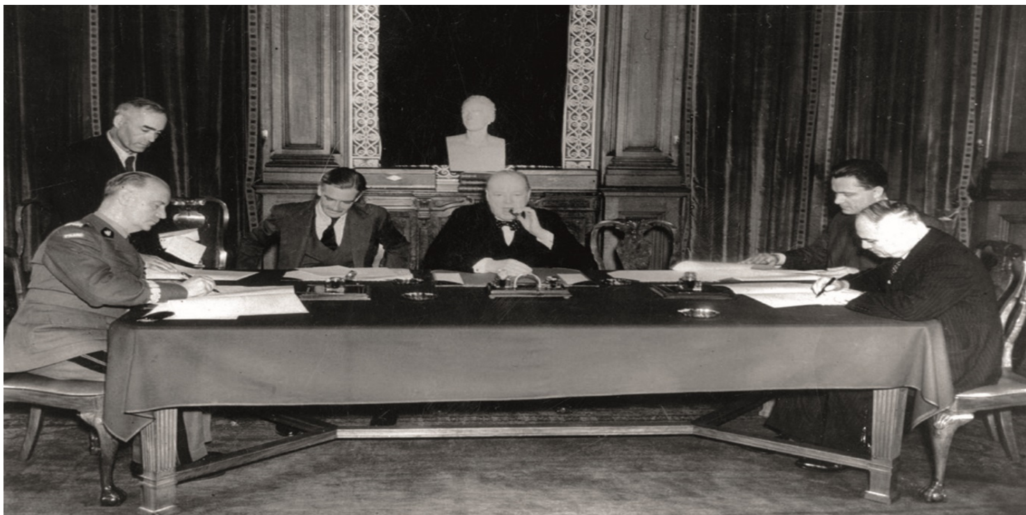
Podpisanie układu o nawiązaniu stosunków między Rzeczpospolitą Polską i ZSRS, od lewej: gen. Władysław Sikorski, N.N., Anthony Eden, Winston Churchill, NN, Iwan Mąjski; Londyn, 30 lipca 1941 r.

https://przystanekhistoria.pl/pa2/teksty/99588,Z-domu-niewoli-do-Iranu.html