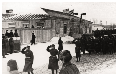
Defilada Armii Polskiej w ZSRS z okazji wizyty Naczelnego Wodza gen. Władysława Sikorskiego, Tockoje, 12 grudnia 1941 r.

Generał Anders zwrócił się po wyjaśnienia do Stalina i otrzymał je 18 marca 1942 r. w bezpośredniej rozmowie z sowieckim dyktatorem. Wynikało z nich, że przyczyną zredukowania dostaw żywności dla wojsk polskich było załamanie się planu dostaw pszenicy do ZSRS z Ameryki. Z uwagi na wybuch wojny z Japonią zmniejszyły się one dziesięciokrotnie. To wymusiło rewizję planu zaopatrzenia Armii Czerwonej, by zapewnić żywność jednostkom frontowym. Po dyskusji Stalin podniósł liczbę racji dla Armii Polskiej, ale tylko do 44 tys. Zgodził się też na propozycję Andersa, by nadwyżkę żołnierzy polskich, dla których brakowało żywności, przerzucić do Iranu. Decyzję zrealizowano błyskawicznie: od 24 marca do 3 kwietnia ewakuowano ok. 33 tys. żołnierzy, a ponadto ok. 11 tys. osób cywilnych.