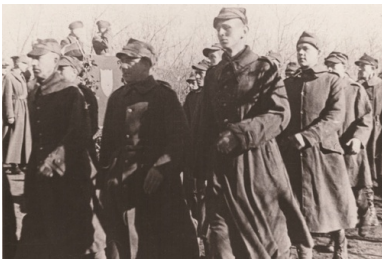
Żołnierze Armii Polskiej w ZSRS, 1941 lub 1942 r.

Układ miał więc w sobie tak wielki potencjał konfliktu na przyszłość, że śmiało nazwać go można bombą z opóźnionym zapłonem. Ekspłodowała ona w kwietniu 1943 r., kiedy to rząd sowiecki faktycznie zerwał stosunki z polskim sojusznikiem.