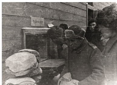
Wydawanie chleba żołnierzom w jednym z obozów Armii Polskiej w ZSRS, 1941 lub 1942 r.

Stalin nie przekazał brytyjskiemu przywódcy, że działa z inspiracji gen. Andersa. Jednak w świetle dostępnych dokumentów nie ulega to żadnej wątpliwości. Pominięcie to sprawiało jednak wrażenie, jakby Sowieci próbowali „dogadywać się” z Brytyjczykami w sprawie wojsk polskich bez udziału czynników polskich.