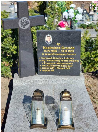
Grób Kazimierza Grendy na Cmentarzu Bożego Ciała w Poznaniu