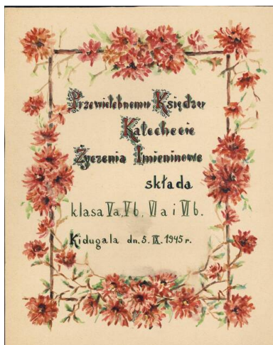
Kolekcja kart z życzeniami imieninowymi dla księży prowadzących polski kościół w Kidugali, z zasobu AIPN