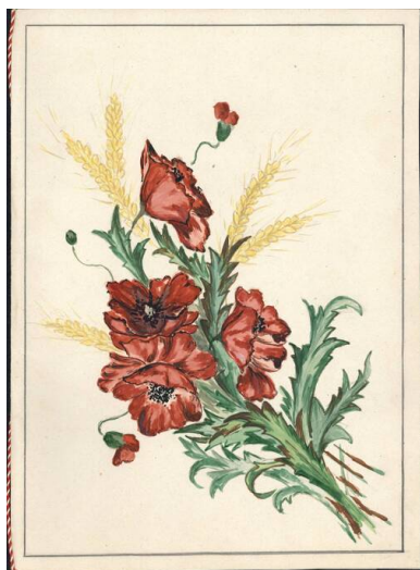
Kolekcja kart z życzeniami imieninowymi dla księży prowadzących polski kościół w Kidugali, z zasobu AIPN