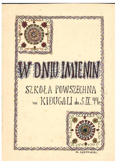
Kolekcja kart z życzeniami imieninowymi dla księży prowadzących polski kościół w Kidugali