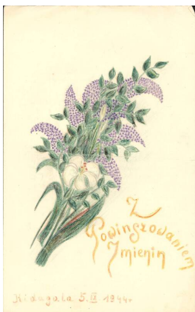
Kolekcja kart z życzeniami imieninowymi dla księży prowadzących polski kościół w Kidugali