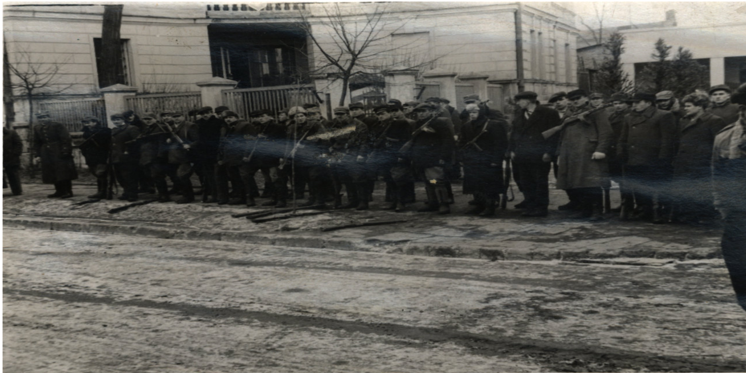
Oddział „Prawdźca”, Radomsko

https://przystanekhistoria.pl/pa2/teksty/99085,Ujawnianie-struktur-Konspiracyjnego-Wojska-Polskiego-wiosna-1947-roku.html