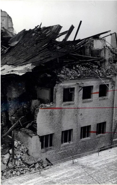
Dokumentacja z miejsca wybuchu i pożaru w Wielkopolskim Przedsiębiorstwie Przemysłu Ziemniaczanego w Luboniu 22 lutego 1972 r.