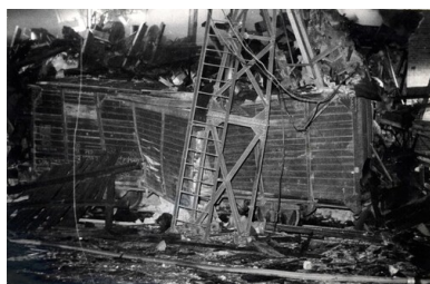
Dokumentacja z miejsca wybuchu i pożaru w Wielkopolskim Przedsiębiorstwie Przemysłu Ziemniaczanego w Luboniu 22 lutego 1972 r.