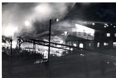
Dokumentacja z miejsca wybuchu i pożaru w Wielkopolskim Przedsiębiorstwie Przemysłu Ziemniaczanego w Luboniu 22 lutego 1972 r.

Wyjaśnieniem przyczyn katastrofy zajęła się Prokuratura Wojewódzka w Poznaniu. Czynności operacyjne podjęła również Służba Bezpieczeństwa. Założono sprawę operacyjnego rozpracowania kryptonim „Luboń”. Jej celem było ustalenie przyczyn wybuchu i pożaru oraz ewentualne wskazanie osób, które mogły bezpośrednio lub pośrednio przyczynić się do zaistnienia katastrofy.