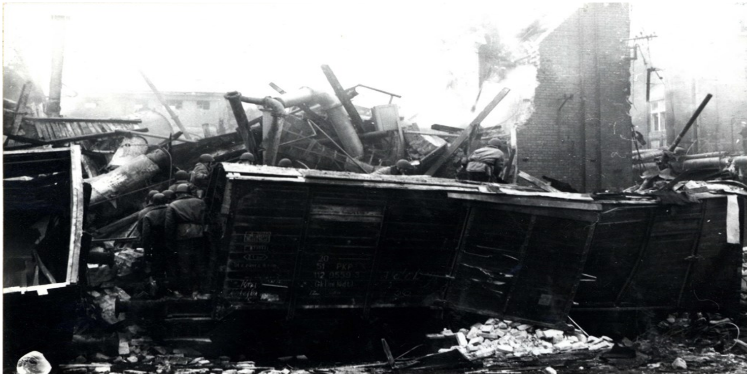
Dokumentacja z miejsca wybuchu i pożaru w Wielkopolskim Przedsiębiorstwie Przemysłu Ziemniaczanego w Luboniu 22 lutego 1972 r.

https://przystanekhistoria.pl/pa2/teksty/99060,Katastrofa-w-Wielkopolskim-Przedsiębiorstwie-Przemysłu-Ziemniaczanego.html