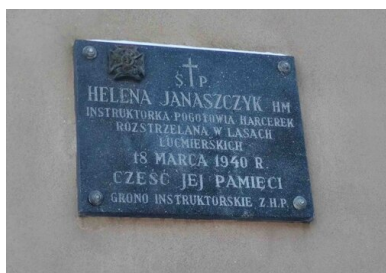
Tablica pamiątkowa na ścianie kościoła Matki Boskiej Zwycięskiej w Łodzi