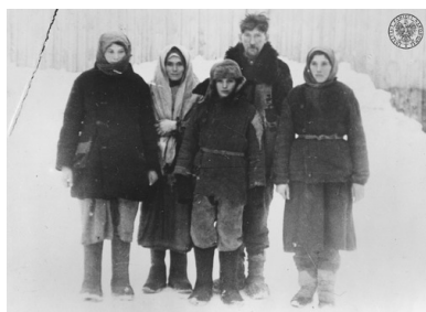
Polscy zesłańcy w Związku Sowieckim.

Właśnie temu służyły deportacje na „niehumanitarną ziemię”. Nie bez powodu pierwsze grupy Polaków, które już w grudniu 1939 r. zostały wyznaczone przez rząd sowiecki do usunięcia z Kresów Wschodnich, składały się głównie z osadników wojskowych, pracowników służby leśnej i kolei oraz ich rodzin.