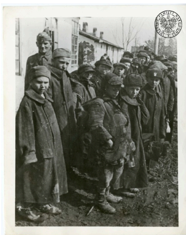
Najmłodszy Polacy po dotarciu do Armii Andersa, 1941/1942 r.