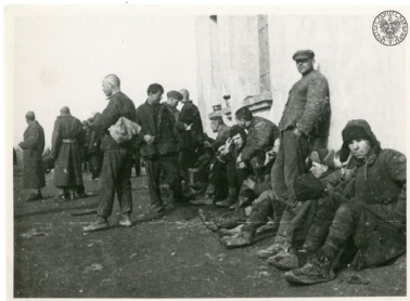
Polacy po przybyciu do Armii Andersa, 1941/1942 r.

A zatem, kto nie zabrał ze sobą jedzenia, ten głodował. W pociągach, u deportowanych, szybko pojawiły się problemy żołądkowe i zaczęły rozwijać choroby zakaźne, które niejednokrotnie z powodu braku jakiegokolwiek pomocy medycznej kończyły się śmiercią. Zwłoki wynoszono z wagonów i pozostawiano przy torach, bez żadnego pochówku. Po kilkunastu dniach, czasem dłużej, tej ciężkiej – zarówno fizycznie, jak i psychicznie – podróży transport docierał do stacji końcowej.