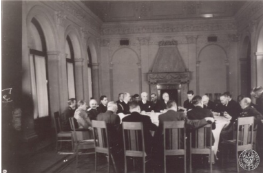
Przedstawiciele Stanów Zjednoczonych, Wielkiej Brytanii i Związku Sowieckiego podczas jednego z posiedzeń konferencji w Jałcie, luty 1945 r.

po stronie polskiej Lwowa i borysławskiego zagłębia naftowego). Na zachodzie przypaść miały Polsce Prusy Wschodnie, jednak bez Królewca, Gdańsk i cały Górny Śląsk. Pomorze Zachodnie i Dolny Śląsk stanowić miały przedmiot przetargu – ziemie te, jako rekompensatę, ofiarowywał Polsce Stalin, który przyobiecał Bierutowi i Osóbce-Morawskiemu, że zachodnia granica Polski biec będzie wzdłuż Odry i Nysy Łużyckiej od Szczecina aż po terytorium Czechosłowacji.