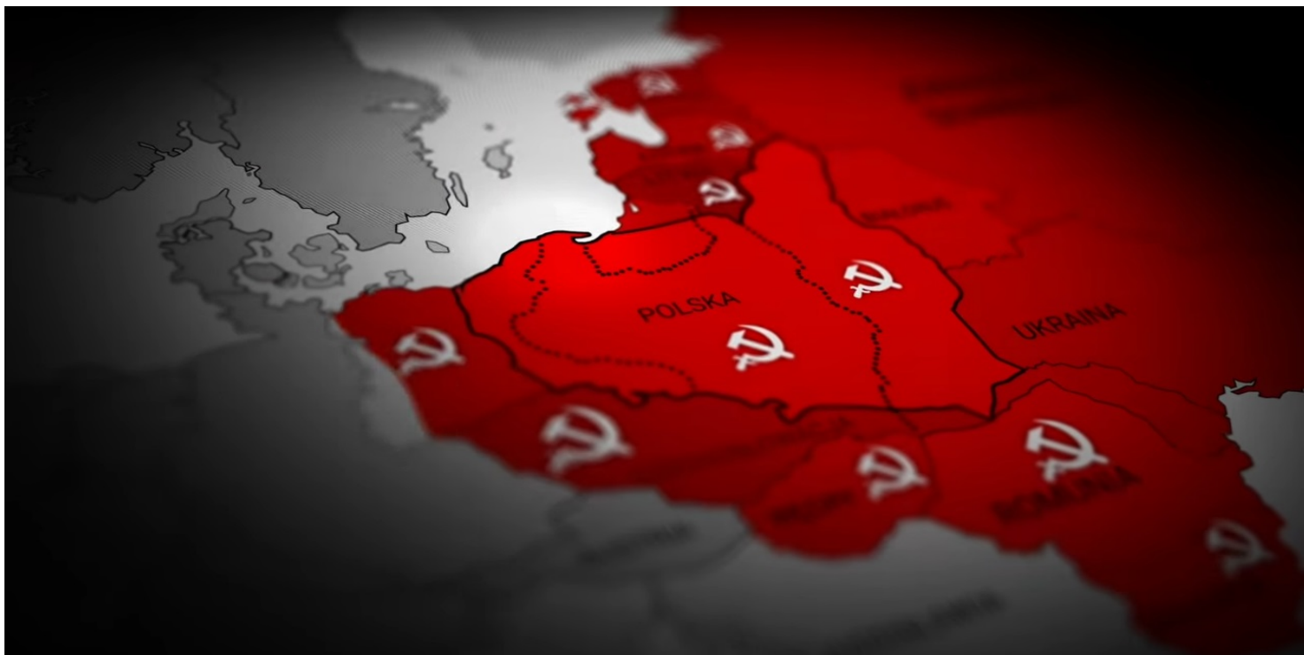
Kadr z filmu IPN Kraków 1945. Nowe zniewolenie

https://przystanekhistoria.pl/pa2/teksty/98557,W-cieniu-Jalty-Fakty-dokonane.html