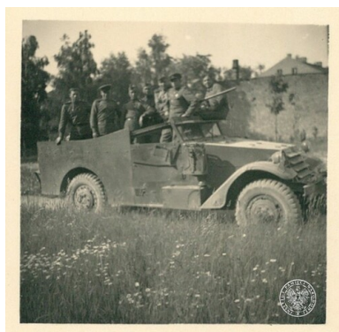
Żołnierze sowieccy w czasie pościgu za oddziałem KWP.

prześcignął okrucieństwem najzacieklejszych gestapowców. Wywołuje swym postępowaniem tak straszne nastroje ludności, że ta wspomina czasy niemieckie i zaczyna masowo szukać ratunku w organizacjach nielegalnych. Codziennie odbywają się masakry chłopów [...]. Żaden z nich już zdrowia nie odzyska - poodbijane wnętrzości, popękane bębunki, połamane kości, poodbijane ciało. W dniu 30 XI 1945 r.b. uciekły z więzienia w Radomsku 23 osoby - wszyscy kaleki - głusi, poparzone prądem elektrycznym ciało" 11 .