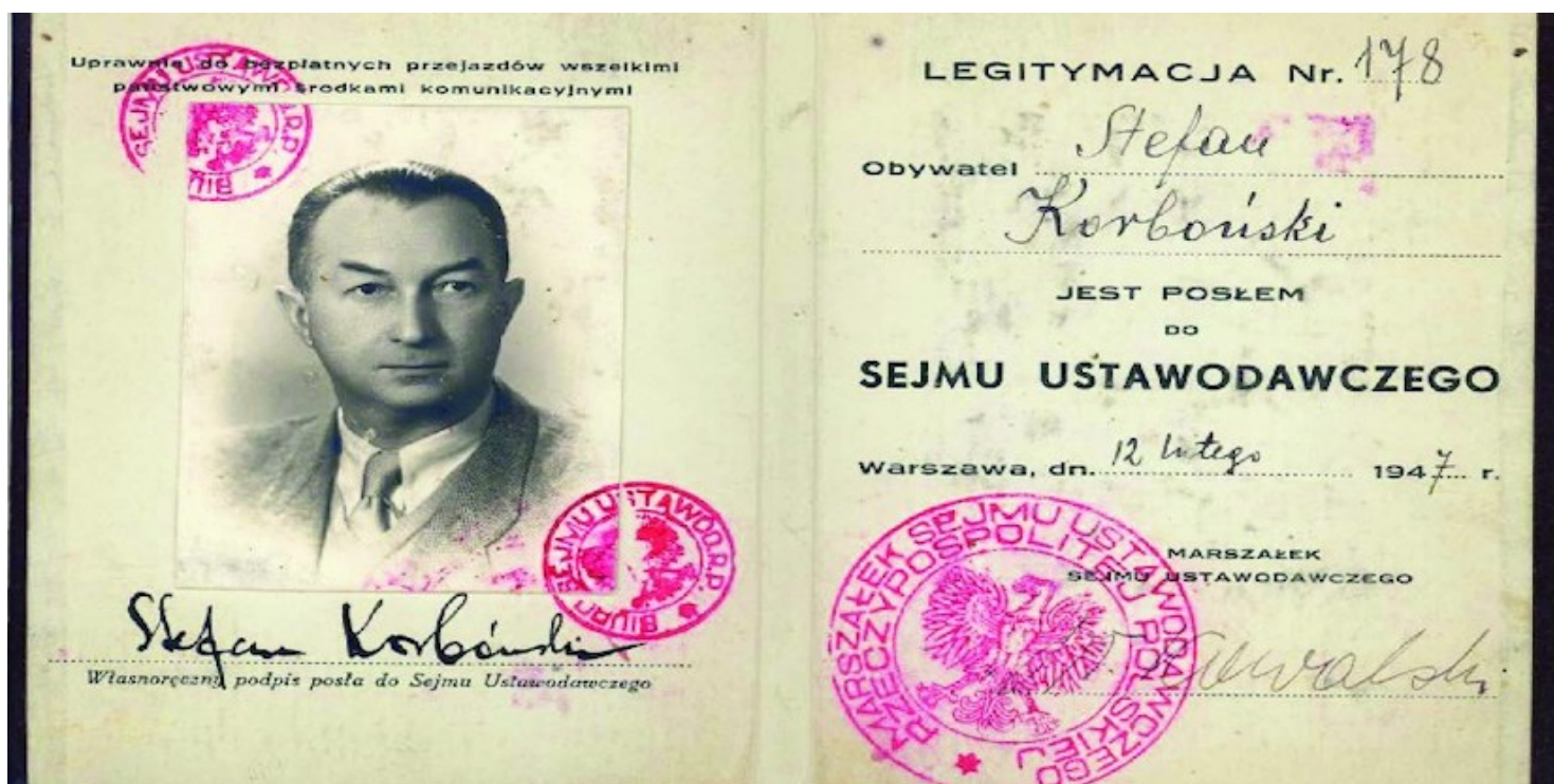
Legitymacja Stefana Korbońskiego, posła na Sejm Ustawodawczy, 12 lutego 1947 r.

https://przystanekhistoria.pl/pa2/teksty/98472,Sad-nad-niepodlegla-Polska.html