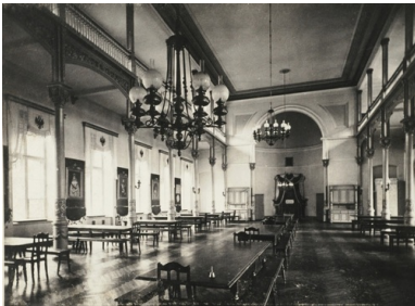
Na fotografii z 1902 r. wnętrze budynku Instytutu Aleksandryjsko-Maryjskiego, który był pierwszą siedzibą parlamentu w II RP.

Odpowiedzią na tę propozycję stał się wybuch, w nocy z 2 na 3 maja 1921 r., kolejnego, trzeciego już powstania. Zryw był najpotężniejszy z dotychczasowych – powstańcy szybko osiągnęli linię Odry. Polityczny błąd Korfanteo, który uznał, że powstanie osiągnęło swój cel i można wrócić do domów, sprawił, że o ziemię śląską trzeba było, w znacznie już trudniejszych warunkach militarnych, nadal krwawo się zmagać. Powstańcy niejednokrotnie dawali przykłady odwagi, zaciętości i determinacji, wspomnieć należy choćby bitwę pod Górą św. Anny. Ostatecznie Rada Ligi Narodów, w kilka miesięcy po przerwaniu walk, podjęła kompromisową decyzję, na mocy której Polska otrzymała zaledwie 29% terytorium plebiscytowego z około 46% ludności, ale za to z bardzo cennymi z gospodarczego punktu widzenia obiektami przemysłowymi.