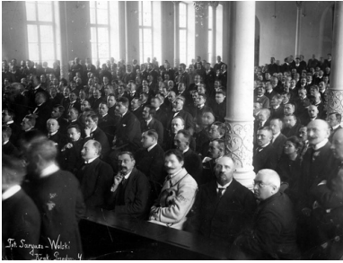
Widok na salę obrad podczas otwarcia sesji sejmowej, 28 listopada 1922 r.

najpoważniejszą rolę odgrywało PSL-„Piast”, padło 24% głosów. Na partie lewicy, przede wszystkim PPS i PSL-„Wyzwolenie”, oddało głosy 25% wyborców. W wyborach tych pojawił się jednak nowy, istotny czynnik. Był nim Blok Mniejszości Narodowych, na którego kandydatów głosowało aż 22% wyborców. Obecność znacznie większej grupy posłów reprezentujących mniejszości narodowe w ważny, a zarazem dramatyczny sposób wpłynęła na przebieg pierwszych wyborów prezydenckich. Dzięki ich głosom pierwszym prezydentem II Rzeczypospolitej został zgłoszony przez PSL-„Wyzwolenie” Gabriel Narutowicz, wybitny uczyony, który po wojnie powrócił ze Szwajcarii, by swój wielki talent oddać w służbę odradzającej się ojczyźnie.