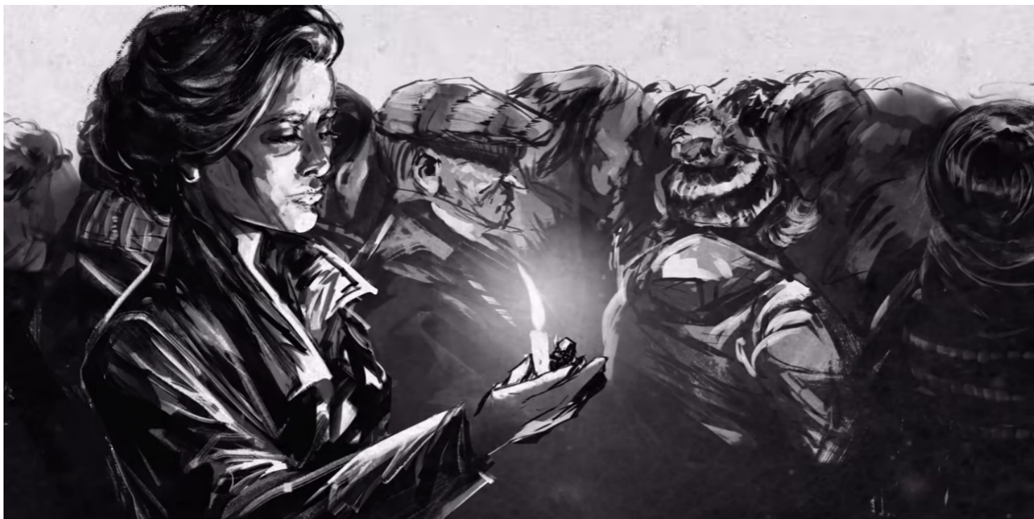
Kadr z filmu IPN Światło Wolności

https://przystanekhistoria.pl/pa2/teksty/97605,Boze-Narodzenie-w-osrodku-odosobnienia-Kielce-Piaski.html