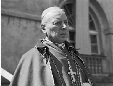
Prymas Stefan Wyszyński