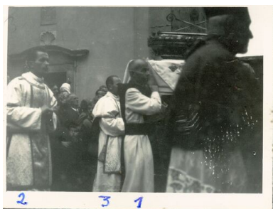
Fotografia inwigilowanych zakonników, kościół Ojców Cystersów w Jędrzejowie, 1961 r.

okres najbardziej intensywnych prześladowań Kościoła. Kres położyło im dopiero uwolnienie prymasa w październiku 1956 r. Przełom polityczny, który miał miejsce w 1956 r., pokazał, że usunięcie religii oraz związanie społeczeństwa polskiego z ideologią marksistowsko-leninowską nie są możliwe. Komunistom nie udało się także zniszczyć wewnętrznej autonomii Kościoła katolickiego. Aresztowania i procesy sądowe przestały być powszechnym narzędziem represji, a powrót w następnych latach do stalinowskich metod okazał się niemożliwy.