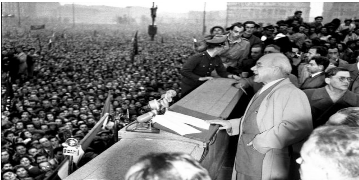
Władysław Gomułka przemawia na pl. Defilad w Warszawie, 24 października 1956

https://przystanekhistoria.pl/pa2/teksty/96126,Kontynuacja-po-przelomie.html