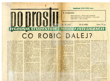
„Po Prostu”, nr 48 (410), 1956. Z zasobu AIPN

Skończyło się na zawieszeniu wydawania pisma w okresie wakacyjnym i decyzji z października 1957 r. o jego zamknięciu. Wywołało to oburzenie środowisk studenckich i sprowokowało kilkudniowe zamieszki (3–6 października) w Warszawie. Wiece brutalnie spacyfikowano – ponad 500 protestujących zostało zatrzymanych, a kilkunastu stanęło przed sądem. Po raz pierwszy użyto w akcji ZOMO, które stało się odtąd poważnym argumentem w „rozmowach władzy ze społeczeństwem”. Bezwzględna interwencja przypominała akcje z okresu stalinowskiego.