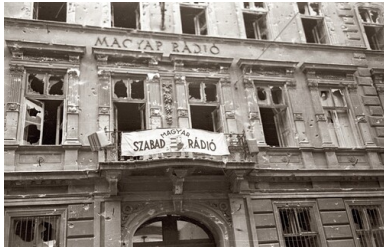
Budynek Węgierskiego Radia, 1956 r.; transparent z napisem „Wolne Radio Węgierskie”.