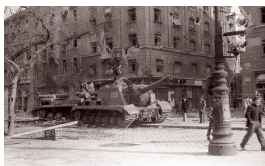
Zniszczone sowieckie haubice szturmowe na bulwarze przy zaułku Corvina. Fot. Fortepan/Album027 (za: „Biuletyn IPN” numer 10/2021)

Wjazd czołgów miał na celu wywołanie popłochu wśród demonstrantów i zmuszenie ich do odwrotu. Podobną akcję – z oczekiwanym rezultatem – przeprowadzono w 1953 r. w Berlinie Wschodnim. Tymczasem 24 października czołgi Lebiediewa, które o świcie pojawiły się na pl. Barárosa w Budapeszcie, przez zorganizowanych w ciągu kilku godzin węgierskich powstańców zostały przywitane salwą ognia i koktajlami Mołotowa.