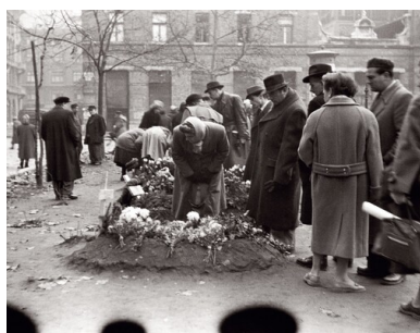
Groby ofiar powstania węgierskiego, pl. Rákóczi, 1956 r.

Hannah Arendt, wybitna amerykańska politolog badająca działanie systemów totalitarnych, węgierski Październik '56 określiła mianem jedynej w historii prawdziwej rewolucji, której uczestników mobilizowały nie postulaty socjalne, lecz pragnienie uzyskania wolności, odmiany świadomości i stanu ducha udręczonych jednostek oraz przywrócenie godności całemu społeczeństwu. To Arendt powiedziała, że węgierski duch 1956 r. jest niegasnącym światłem ludzkości.