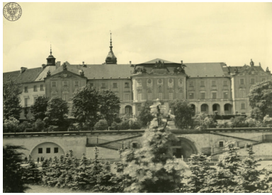
Zamek Królewski od strony Wisły przed zbombardowaniem, 1939 r.

drang nach Osten i zdobywania przestrzeni życiowej dla Niemców.