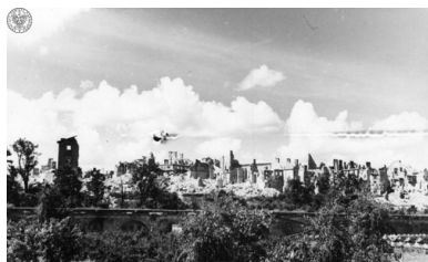
Ruiny Zamku Królewskiego i Starego Miasta. Panorama od strony Wisły

Z chirurgiczną precyzją Niemcy realizowali swój morderczy plan. Przyczynili się do ogromnych zniszczeń zabudowy miejskiej: Stare Miasto zostało zrównane z ziemią, wysadzono Zamek Królewski, kolumnę Zygmunta, palono bezcenne zbiory (zgromadzone w stołecznych bibliotekach i archiwach), zniszczono obiekty strategiczne pod względem politycznym i gospodarczym, palono fabryki i zakłady produkcyjne. Miała też miejsce zakrojona na szeroką skalę grabież mienia i dóbr kultury.