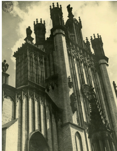
Fronton i wieżyczki katedry św. Jana w Warszawie, 1939 r.

Wybuch Powstania Warszawskiego stał się dla Hitlera okazją do rozwiązania „sprawy polskiej”. Nie zmieniły tego formalne obietnice złożone stronie polskiej w akcie kapitulacji podpisanym 2 października. Ostatnim akordem rozprawienia się z Polakami i wcielenia w życie niemieckich planów była ogłoszona 9 października decyzja o zburzeniu Warszawy.