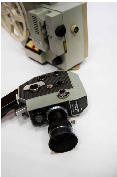
3c Kamera Quarz-Zoom 8 mm DS8-3 i projektor 8 mm PYCb -

Poza urządzeniami używanymi przez profesjonalistów do rejestracji obrazu (a z czasem obrazu i dźwięku) na taśmie filmowej produkowany był również sprzęt amatorski do bardziej powszechnego użytku. Produkty skierowane do prywatnych odbiorców dość powszechnie stosowane były jeszcze w latach osiemdziesiątych. Za pomocą kamery naświetlano podwójną taśmę, a następnie wywoływano ją i przecinano wzdłuż na pół. Po tych zabiegach filmy można było odtwarzać na przystosowanych do nich rzutnikach.