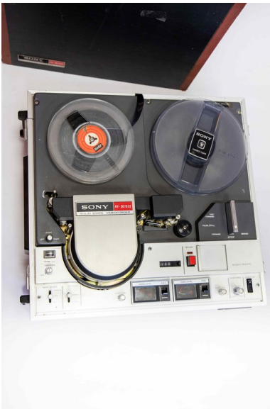
4d Magnetowid Sony AV-3670CE