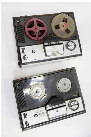
1b Magnetofon ZK 125 i ZK 140T

Jednym ze sposobów utrwalenia dźwięku był jego zapis na taśmie magnetycznej umieszczonej na szpuli. Do początku lat dziewięćdziesiątych najczęściej spotykanymi magnetofonami szpulowymi była rodzina dwu- i czterościeżkowych magnetofonów ZK produkowanych na licencji firmy Grundig. Urządzenia wyposażone były w głośnik. Zdarzały się również magnetofony z tzw. prywatnego importu – np. firmy Thomson.