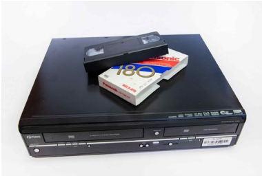
4b Magnetowid VHS-DVD Funai WD6D-D4413DB z kasetą VHS