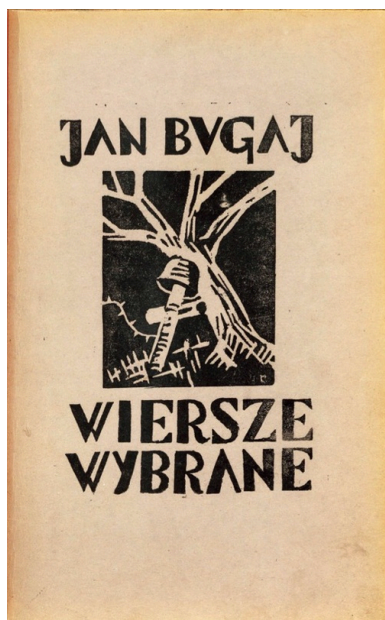
Okładka podziemnego wydania wierszy Krzysztofa Kamila Baczyńskiego z 1942 r.

W połowie 1943 r., gdy twórczość Baczyńskiego osiągnęła poetycką i myślową dojrzałość, podjął także brzemienne w skutkach decyzję obywatelskiej służby. Wstąpił do konspiracyjnych szeregów Armii Krajowej (najpierw w Harcerskich Grupach Szturmowych), a po przeszkoleniu wojskowym trafił do batalionu „Zośka”. Doszedł do tej decyzji, o której opowiada w wierszu Wybór , później niż jego koledzy – głównie ze środowiska „Sztuki i Narodu” – aktywni w konspiracji prawie od początku wojny, ale było to postanowienie dojrzałe i przemyślane. Zrodziło się zapewne także pod wpływem tragicznych wydarzeń, które miały niedługo tak mocno uderzyć w środowisko Konfederacji Narodu oraz „Sztuki i Narodu”.