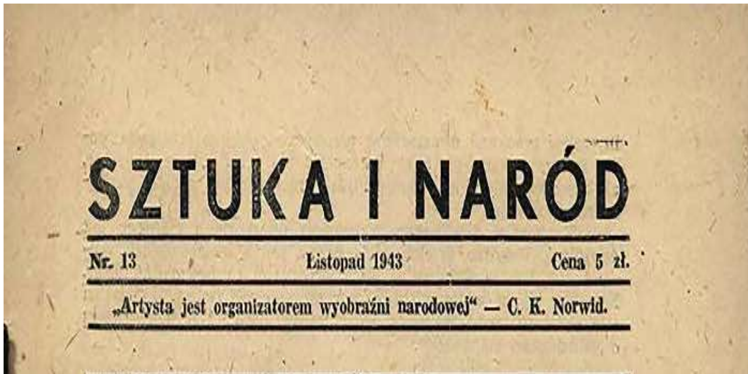
Poezja w czasach zagłady. Historia i pamięć o wojennym pokoleniu poetów

https://przystanekhistoria.pl/pa2/teksty/94975,Poezja-w-czasach-zaglady-Historia-i-pamiec-o-wojennym-pokoleniu-poetow.html