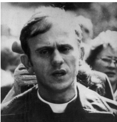
Ksiądz Jerzy Popiełuszko

Te obawiały się szczególnie jego „kultu”. Tym bardziej niepokojące musiały się dla nich wydać informacje, które dotarły do części peerelowskiego kierownictwa w dniu 15 kwietnia 1985 r. Wówczas to w Ministerstwie Spraw Wewnętrznych przygotowano załącznik do „Informacji Diennej MSW”, który otrzymało kilkanaście (dokładnie jedenaście) osób. Byli wśród nich m.in. I sekretarz Komitetu Centralnego Polskiej Zjednoczonej Partii Robotniczej i premier Wojciech Jaruzelski, wicepremier Mieczysław Rakowski czy minister – kierownik Urzędu ds. Wyznań Adam Łopatka oraz przewodniczący Rady Państwa Henryk Jabłoński.