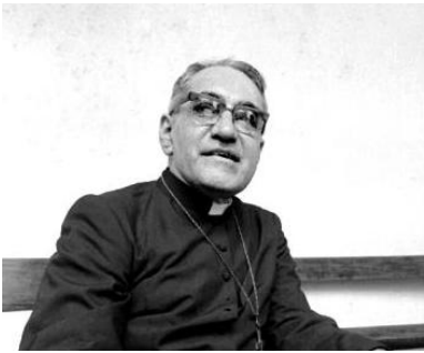
Arcybiskup Oscar Romero

To była z punktu widzenia peerelowskich władz czy szerzej krajów tzw. demokracji ludowej informacja pozytywna.