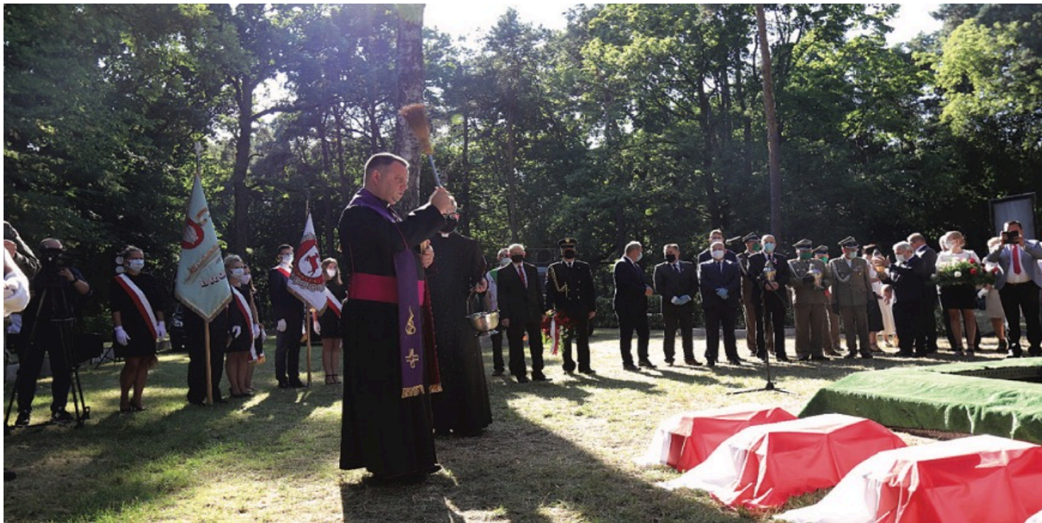
Pogrzeb żołnierzy poległych w 1920 r., w bitwie pod Brodnicą

https://przystanekhistoria.pl/pa2/teksty/94397,Ekshumacje-zolnierzy-Armii-Ochotniczej-i-upamietnienie-jej-bohaterow.html