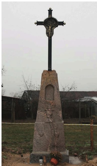
Krzyż przydrożny z 1899 r. w Mątwicy

Żołnierze zostali pochowani 14 sierpnia 2019 r. na cmentarzu parafialnym w Łomży w mogile zbiorowej ze swoimi towarzyszami.