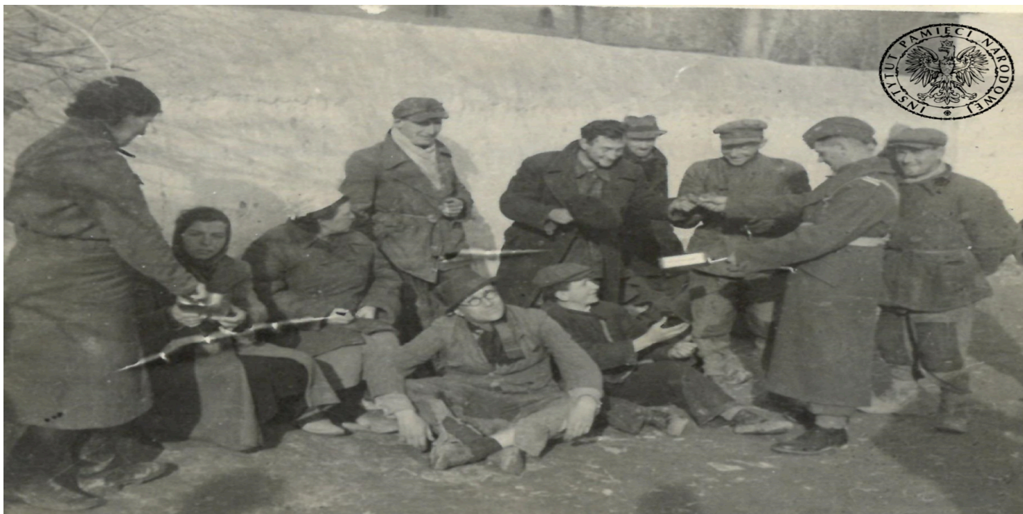
Polscy ochotnicy w drodze do punktów zbórnych armii Andersa

https://przystanekhistoria.pl/pa2/teksty/94382,Bialy-kon-dla-Andersa.html