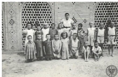
Polskie dzieci w Isfahanie

Powstanie Armii Polskiej w ZSRS było bezpośrednim wynikiem zawarcia układu Sikorski-Majski w dniu 30 lipca 1941 r., ten zaś z kolei był skutkiem napaści Niemiec na ZSRS, zmiany sojuszy i włączenia przez aliantów ZSRS do koalicji antyhitlerowskiej, dla której zagrożeniem były napięte relacje polsko-sowieckie.