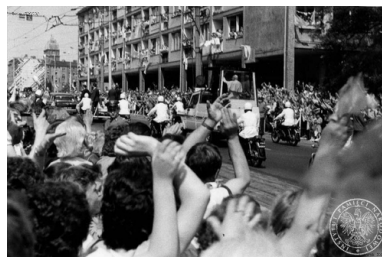
Jan Paweł II przejeżdża ulicami Szczecina pozdrawiany przez wiernych, 11 czerwca 1987 r.