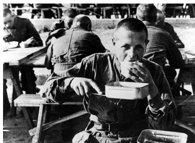
Posiłek w obozie w Tockoje, 1941-1942 r.

Dzieje 6. Dywizji Piechoty na terenie Związku Sowieckiego dobiegły końca wraz z drugą ewakuacją PSZ w ZSRS na przełomie sierpnia i września 1942 r. Pierwszy transport z dywizji wyjechał z Szachrisabz 16 sierpnia 1941 r., a 25 sierpnia pierwsi żołnierze opuścili granice ZSRS udając się do Pahlavi.