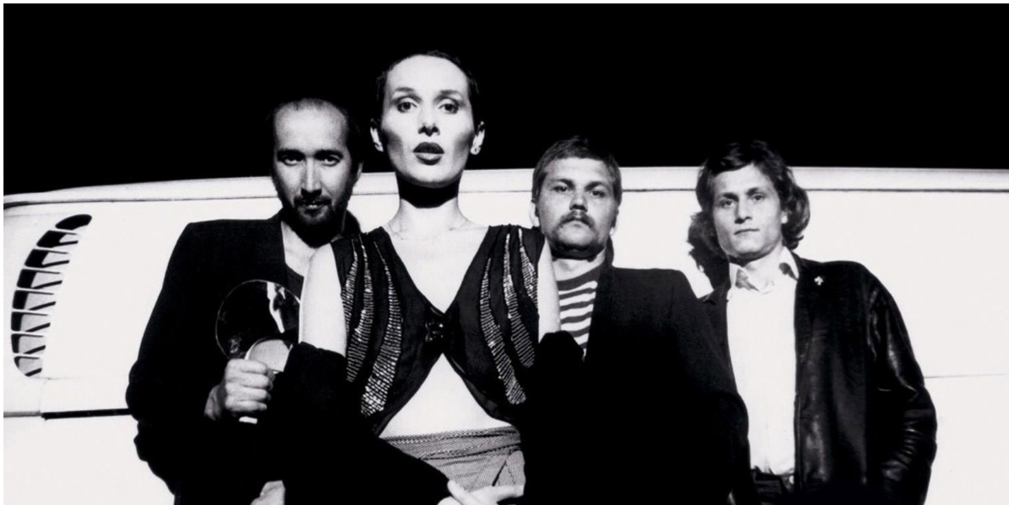
Artyści zespołu Maanam

https://przystanekhistoria.pl/pa2/teksty/93107,Ida-kolnierze-czyli-o-udostepnianiu-rozpowszechnianiu-i-cenzurze-muzyki-rockowej.html