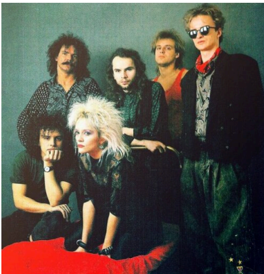
Artyści zespołu Lombard

Warto przy tym temacie unikać uproszczeń, banalizacji, czy interpretacji w tonie zbyt komediowym, jednak ze znanych relacji i dostępnej literatury wynika, że kontakty z cenzurą były dla twórców rockowych kłopotem, z którym na ogół radzili sobie sprawnie i, poza wyjątkami, cenzura nie przyczyniła się do drastycznego ograniczenia ich działalności. Doznawali nieraz uczucia upokorzenia i wściekłości, poza tym kontaktowali się z rzeczywistością absurdalną, ale przede wszystkim zdroworozsądkowo szukali najlepszego rozwiązania (tzw. furtki). Niektórzy z wykonawców czy ich menadżerów przychodzili nawet do urzędu z własną maszyną do pisania, pogodzeni zawczasu z koniecznościami wyższymi i sprawę załatwiali od ręki.