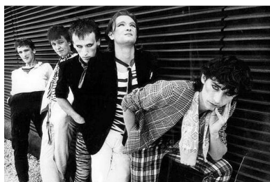
Artyści zespołu Lady Pank

W latach 1983–1989 pod egidą tygodnika Razem (wydawanego pod patronatem Związku Socjalistycznej Młodzieży Polskiej, drukującego plakaty i wywiady z muzykami rockowymi) działał Klub Płytowy „Razem”. Była to specyficzna wytwórnia rozprowadzająca nagrane przez siebie i wydawane w pięciotysięcznych nakładach płyty długogrające (tzw. longplaye) jedynie wśród wcześniej zapisanych członków tegoż klubu. Pięciotysięczne nakłady, jak na ówczesne zapotrzebowanie, okazywały się kroplą w morzu potrzeb, w ten jednak sposób próbowano docierać z muzyką do najbardziej nią zainteresowanych, a zarazem półśrodkami radzić sobie z niedostatkami technicznymi, materiałowymi, finansowymi, słowem z tzw. limitami wynikającymi z braku mocy produkcyjnych wytwórni państwowych. Spośród zespołów – dziś powiedzielibyśmy – offside’owych, wydano między innymi longplaye grup Sztwywny Pal Azji, Dezerter, Kult, Kobranocka, T. Love; a także dwie płyty glamrockowego Azylu P., rockmetalowego Turbo oraz zespołów z czołówki mainstreamowej: Lombard, Lady Pank, Maanam.