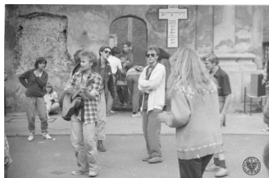
Uczestnicy festiwalu w Jarocinie

Starszy cenzor czasem celowo wychodził z gabinetu i zostawiał temu młodszemu pole do negocjacji z ludźmi bliższymi sobie wiekiem. Muzyków traktowano więc protekcyjnie, ale obywało się bez zastraszania. Co przy tym ciekawe, choć niezaskakujące, cenzorzy w ogóle nie ingerowali w słowne ataki na Kościół.