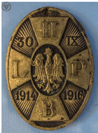
Odnaka pamiątkowa II Brygady Legionów Polskich.