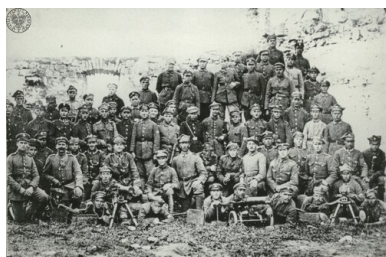
Legiony Polskie w polu.