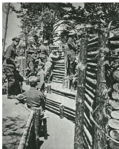
Żołnierze 4. Pułku Piechoty