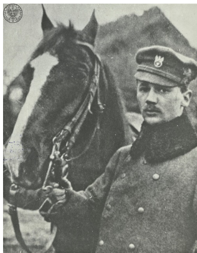
Mjr Tadeusz Furgalski „Wyrwa” z I Brygady Legionów na froncie wschodnim nad rzeką Stochód, 1916 r.

Postawa ochotniczych i „obywatelskich” Legionów Polskich, ich ofiarna walka z wielokrotnie liczniejszym i lepiej uzbrojonym przeciwnikiem, znacząco przyczyniła się do wydania w cztery miesiące później przez cesarza Niemiec i Austro-Węgier „Aktu 5 listopada”, obietnicy powstania „samodzielnego” Królestwa Polskiego.