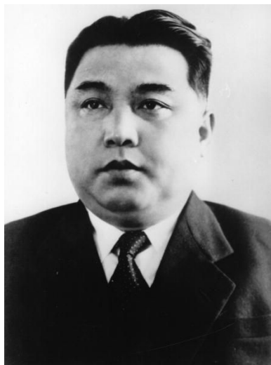
Kim Il Sung (ok. 1950 r.)

Wiele wskazuje na to, że rozbięcie przez Jaruzelskiego „Solidarności” imponowało Kim Il Sungowi, zwłaszcza, że reżim dokonał tego bez udziału sił zewnętrznych, co było dla Kim Il Sunga – obawiającego się ewentualnych prób obalenia go przez Moskwę lub Pekin – szczególnie istotne. Nie może więc zaskakiwać, że KRL-D zainicjowała współpracę między organami bezpieczeństwa obu państw. Pierwsza delegacja północnokoreańskiej bezpieki odwiedziła PRL w lipcu 1983 r., a w programie pobytu znalazła się m.in. wizyta w jednostce ZOMO.