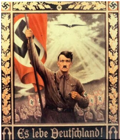
Niemiecki nazistowski obraz propagandowy

Jesteś reprezentantem partii i według tego postępuj. Być narodowym socjalistą to znaczy dawać przykład!