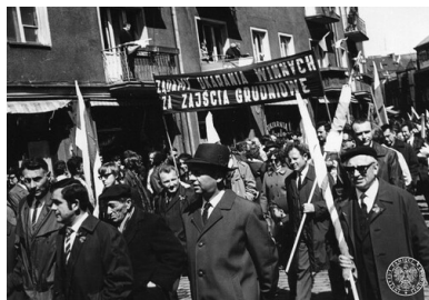
1971, pochód 1 maja na ulicach Gdańska.

Z upływem czasu symbolika niezależnych demonstracji stopniowo ulegała wzbogaceniu. Przed manifestacjami 11 listopada 1978 r. rozklejono w Warszawie plakaty ROPCiO z przedwojennym godłem Polski – orłem w koronie. Warto nadmienić, że różne wizerunki orła w koronie, często odmienne od godła II RP, pojawiały się już wcześniej na ulotkach, czy też na stronie tytułowej wychodzącego w latach 1976–1977 drugoobiegowego pisma „U progu”.