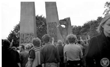
Poznań, 28 czerwca 1984 r. Pod pomnikiem Czerwca 1956.