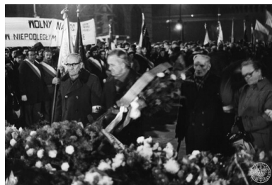
Uroczystości z okazji 63. rocznicy odzyskania niepodległości przed Grobem Nieznanego Żołnierza na pl. Matejki w Krakowie, 11 XI 1981 r.