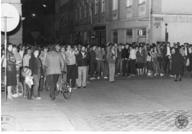
Manifestacja 3 maja 1984 r. w Rzeszowie.