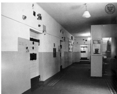
Wnętrze Aresztu Śledczego w Radomiu, gdzie - po pacyfikacji Polaków przez siły reżimu Gierka w czerwcu 1976 r. - trafiali zatrzymani demonstranci i miały miejsce „ścieżki zdrowia”.