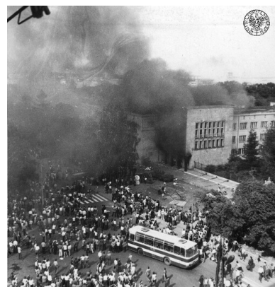
Czerwiec`76: płonący budynek komunistów „wojewódzkich” w Radomiu.