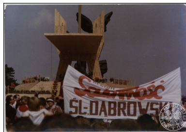
Jan Paweł II przejeżdża ulicami Szczecina pozdrawiany przez wiernych, 11 czerwca 1987 r.