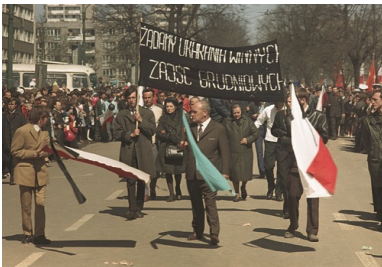
Żałobny protest 1 maja 1971 r. w Szczecinie.

obciążyć miejscowe władze. I choć nie wyrażono tego wprost, za grudniowy dramat – oczywiście w wymiarze regionalnym – obwiniano przede wszystkim płk. Juliana Urantówkę, komendanta wojewódzkiego milicji, i podległe mu służby.