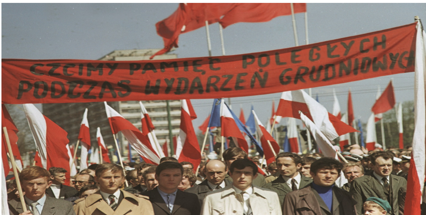
Żałobny protest 1 maja 1971 r. w Szczecinie.

https://przystanekhistoria.pl/pa2/teksty/91466,Zalobna-manifestacja-1-maja-1971-roku-w-Szczecinie.html