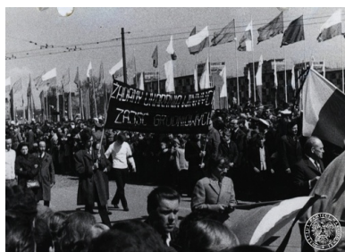
1 maja 1971 r. w Szczecinie.

– wspominała później Chmielewska 20 . Dzięki tej determinacji Toczka wypuszczono z aresztu 21 .