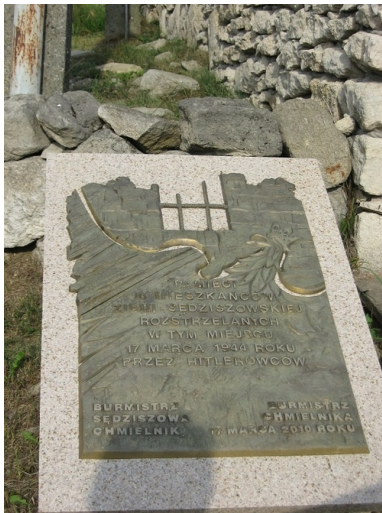
Tablica upamiętniająca kolejarzy z Sędziszowa