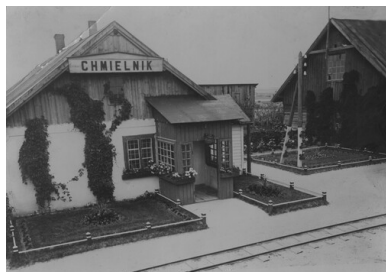
Budynek stacji kolejowej w Chmielniku k. Kielc. Okres Drugiej

Aresztowanych przetrzymywano początkowo w Jędrzejowie, a następnie w więzieniu w Kielcach przy ul. Zamkowej.