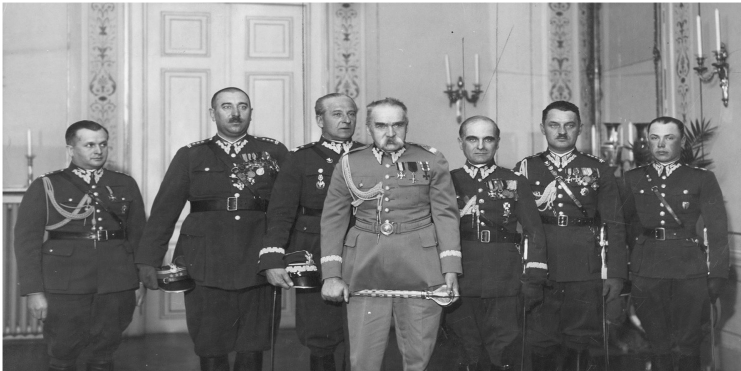
Członkowie delegacji kawalerii polskiej w towarzystwie marszałka Polski Józefa Piłsudskiego (Zygmunt Piasecki drugi od lewej), 8 kwietnia 1934 r. Fot. ze zb. NAC

https://przystanekhistoria.pl/pa2/teksty/90151,General-brygady-Zygmunt-Piasecki-1893-1954-od-ulana-do-emigranta.html