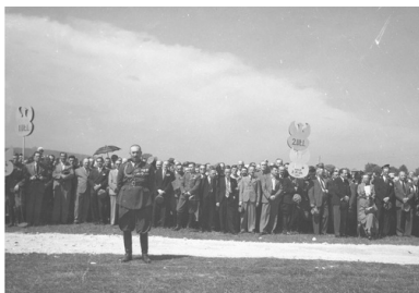
Zjazd Legionistów w Krakowie w 1939 r. Na pierwszym planie stoi gen. bryg. Zygmunt Piasecki, fot. ze zb. NAC

polskie wojsko, ale po internowaniu przez władze rumuńskie został przekazany Niemcom, którzy osadzili go w Oflagu VII A Murnau.