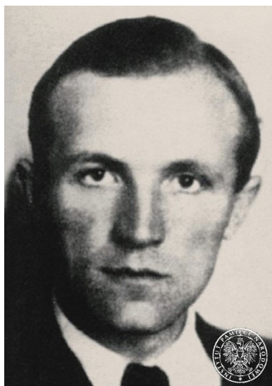
Ppłk Wincenty Kwieciński.

Latem 1947 r. Ciepliński spotkał się z Jerzym Woźniakiem „Jackiem”, przybyłym z Londynu do Polski kurierem Delegatury WiN, który przekazał mu nowe szyfry, kalkę tajnopisu, ale co ważniejsze – informacje z kręgów polskiej emigracji, że w obecnym geopolitycznym układzie sił nie można oczekiwać wybuchu III wojny światowej, na co tak bardzo liczone. Delegatura stanowczo odradzała też prowadzenie dalszej działalności konspiracyjnej, która mogła zakończyć się jeszcze większymi represjami wobec członków podziemia ze strony aparatu totalitarnej władzy i naruszyć poniesionymi ofiarami biologiczną substancję narodu. Wspominając po latach to spotkanie, Woźniak opowiedział o długim milczeniu swojego rozmówcy.