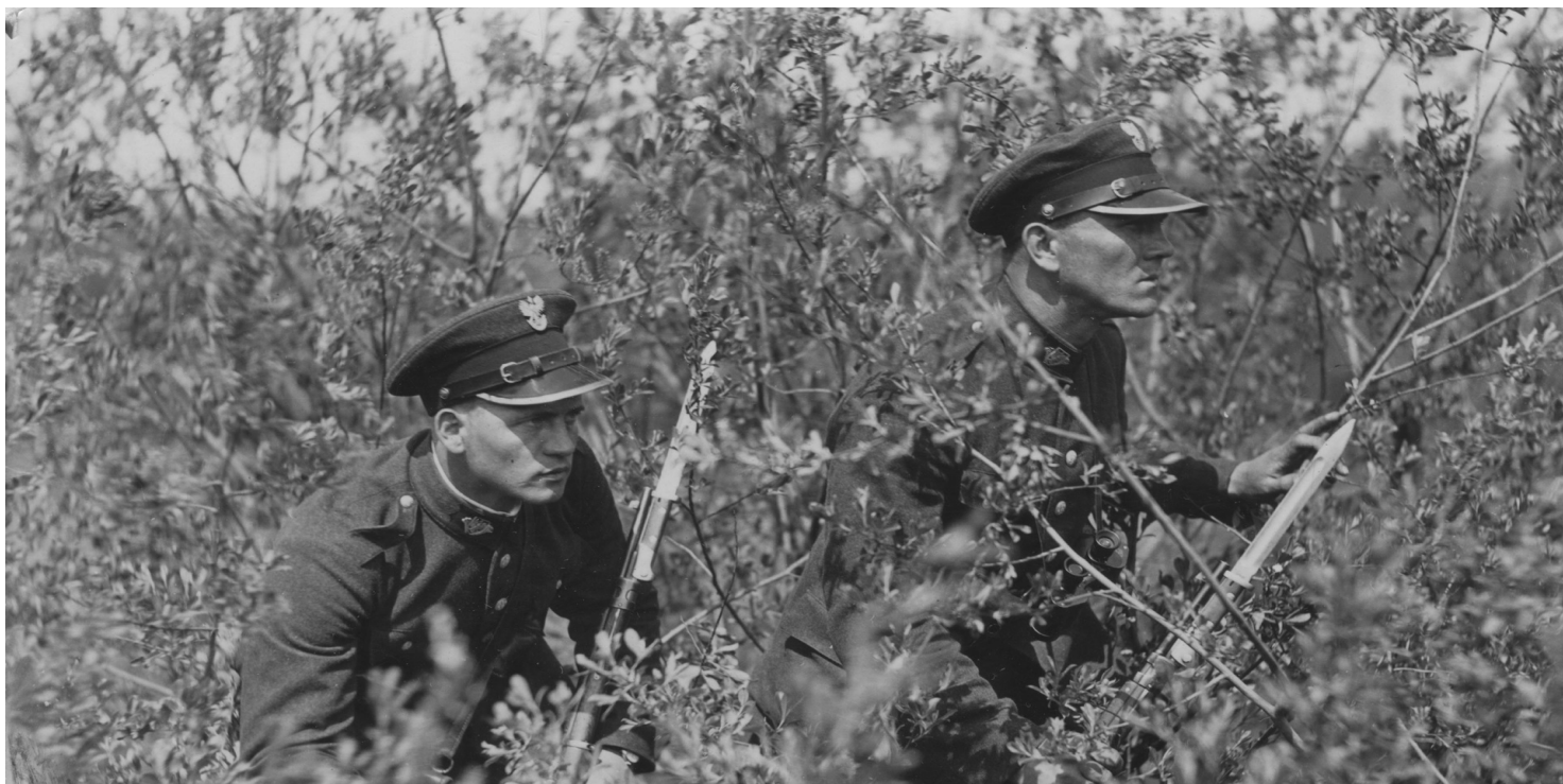
Patrol Straży Granicznej z okresu II RP.

https://przystanekhistoria.pl/pa2/teksty/89383,Zamordowany-obronca-granicy-RP.html